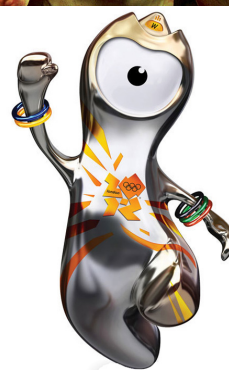
Figura 6 – Fauno , segundo a visão do cineasta mexicano Guillermo del Toro, e Wenlock , o mascote das olimpíadas de Londres: ênfase expressiva na deformação dos olhos.