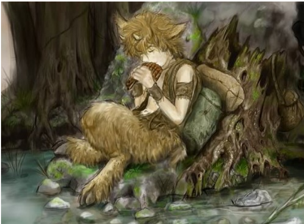
Figura 2 – Ilustração de Pan

Em versão acentuadamente romana, o mito de Pan!