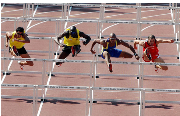
Figura 5 – Jogos da era moderna