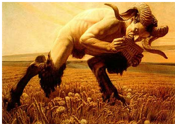
Figura 1 – Ilustração de Fauno

Fauno (do latim Faunus, "favorável" ou também Fatus, "destino" ou ainda "profeta" ) é nome exclusivo da mitologia romana, de onde o mito originou-se, como um rei do Lácio que foi transmutado em deus e, a seguir, sofreu diversas modificações, sincretismo com seres da religião grega ou mesmo da própria romana, causando grande confusão entre mitos variados, ora tão mesclados ao mito original que muitos não lhes distinguem diferenças (como, por exemplo, entre as criaturas chamadas de faunos – em Roma – e os sátiros, gregos). (KURY, M.G. Dicionário de Mitologia Grega e Romana . Rio de Janeiro: J. Zahar, 1990).