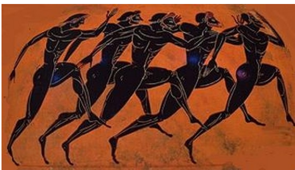
Figura 3 – Ilustrações Gregas

A coisa mais importante nos Jogos Olímpicos não é vencer, mas participar, assim como a coisa mais importante na vida não é o triunfo, mas a luta. O essencial não é ter vencido, mas ter lutado bem. (CARTA OLÍMPICA http://www.cob.org.br )