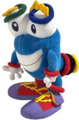
Figura 7 – O sorriso como elemento de semelhança entre as figuras do Sátiro e do mascote Izzy –dos Jogos Olímpicos de 1996 em Atlanta.